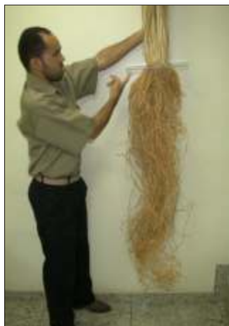
Fig. 4 - Detalhe da planta do Vetiver, mostrando o comprimento das raízes em uma planta com 02 (dois) anos de idade.

Introdução: O Vetiver, uma gramínea de origem indiana, conhecido no mundo científico como Vetiveria zizanioides , tem sido utilizado para diversas finalidades, como: aromatizantes, perfumes finos, planta medicinal e protetores do solo. Entretanto, o Vetiver tem sido plantado em sua maioria junto a banquetas de arroz, nas margens de rios e lagos, taludes de canais, para estabilizar e evitar o carreamento de sedimentos para os cursos d'água.