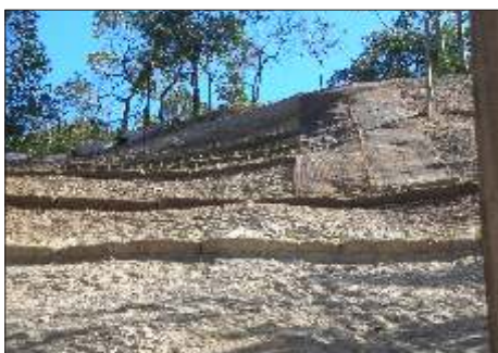
Fig. 2 - Detalhe das bermas artificiais construídas com uso de retentores de sedimentos tipo Bermalonga® e Capim Vetiver, em taludes instáveis, com posterior proteção com biomantas antierosivas.