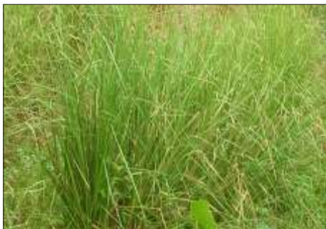
Fig. 1 - Vista geral das barreiras de Capim Vetiver, plantadas em curva de nível, transversalmente à declividade dos taludes.